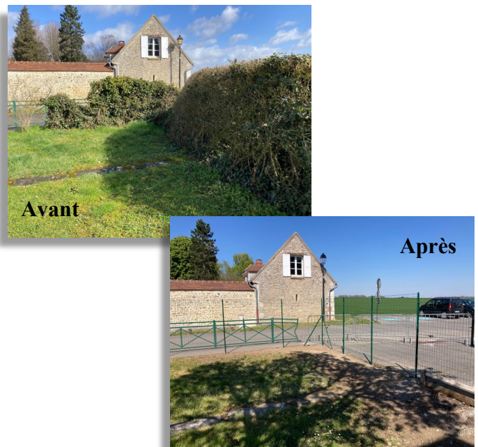
Embellissement de l'entrée de l'école par la rue de la Mairie