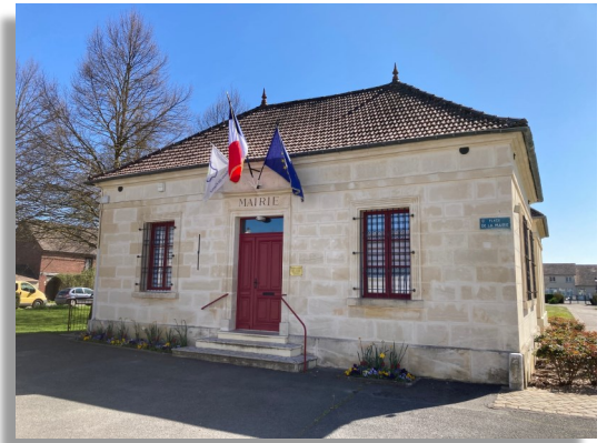
Remise en peinture de la porte et des fenêtres de la Mairie