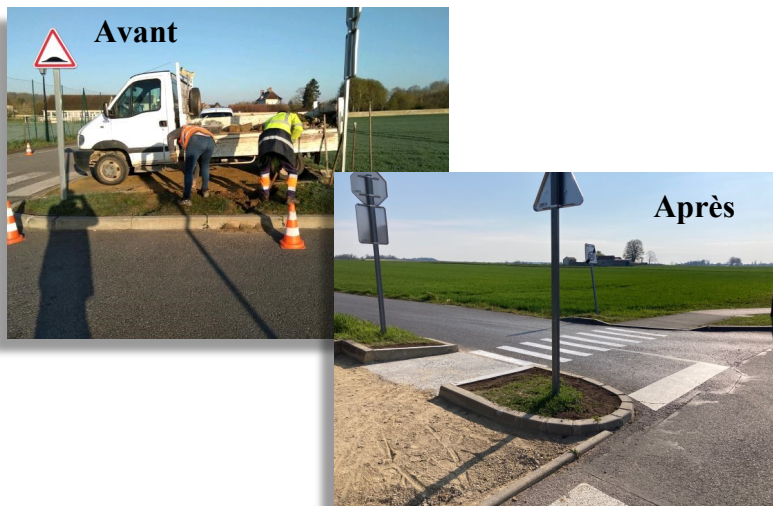
Passage piétons - rue du Bas Parc