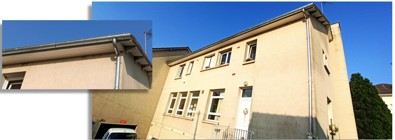
Changement des gouttières et remise en peinture des cache moineaux dans la descente des services techniques