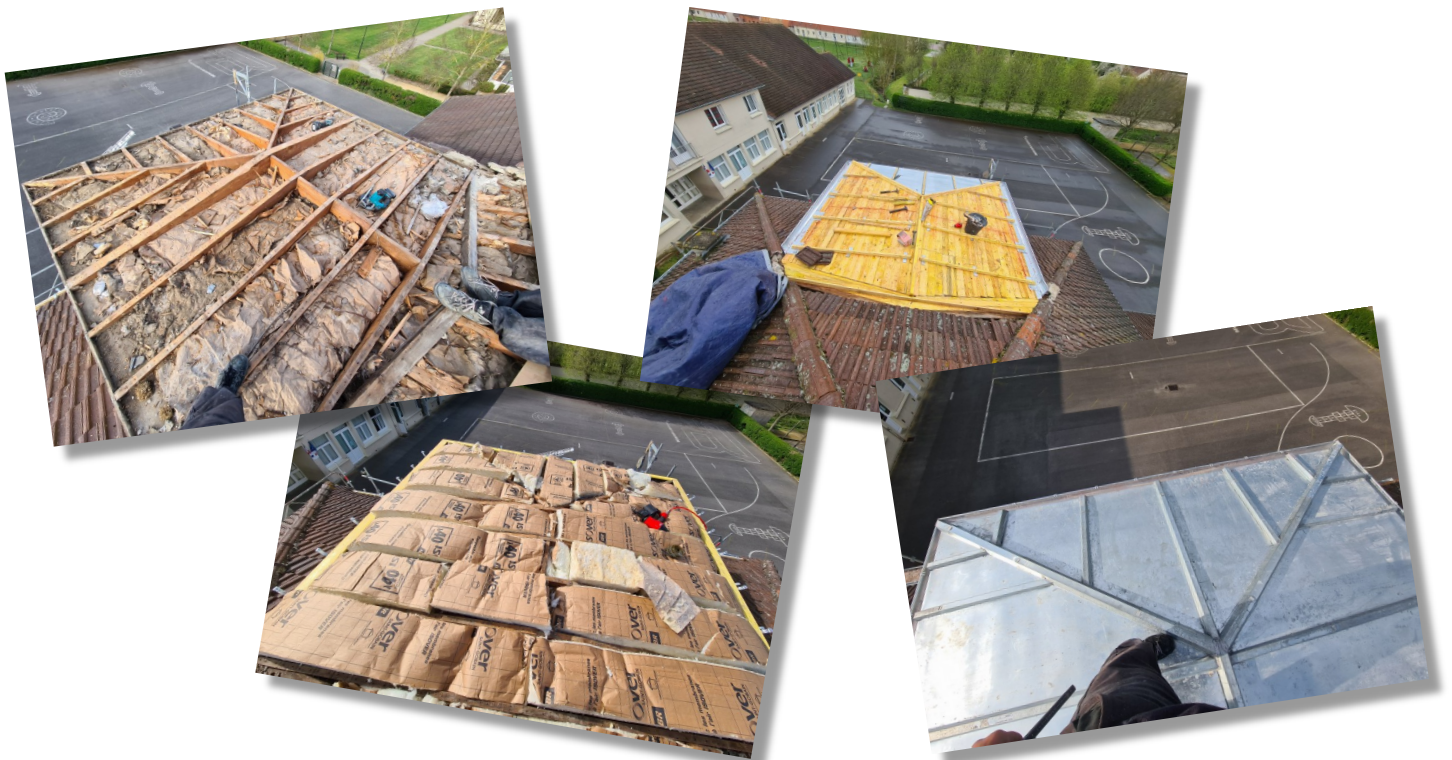
Rénovation de la toiture zinc du deuxième bâtiment de l'école