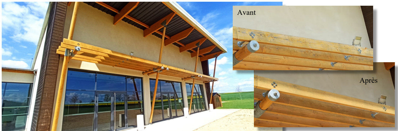
Entretien en lasure des poutres de la salle « Henri Sénéchal »