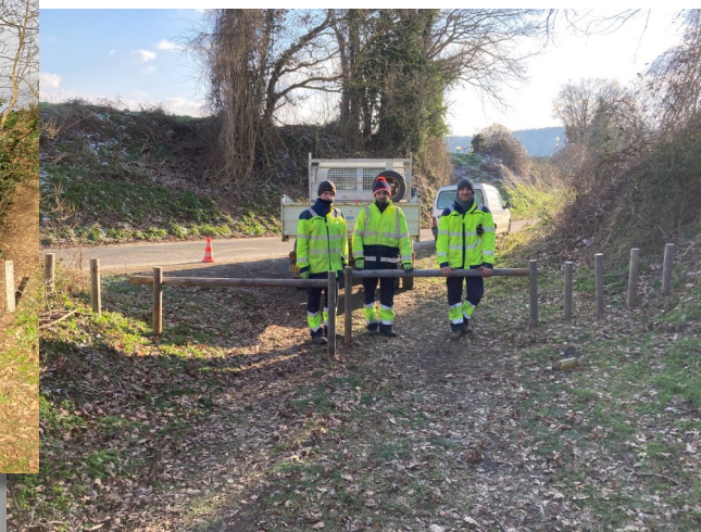
La Chaussée Brunehaut